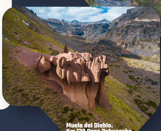
Muela del Diablo. Km 130 Paso Pehuenche.